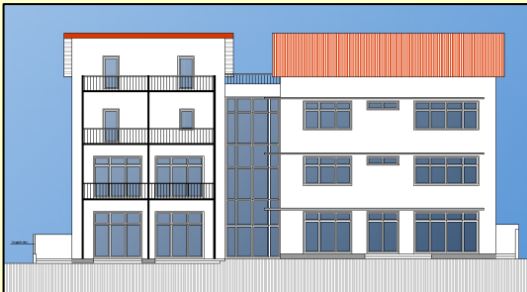
Gebäude: ↑ Ostansicht