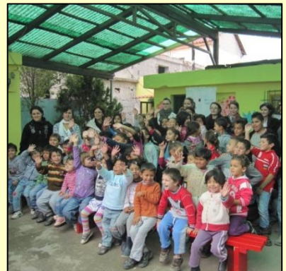
Kinder der Tagesstätte