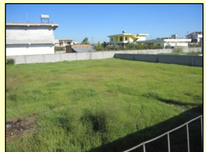
Land für Neubau